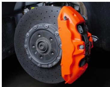
③ 全ての塗装作業が終わったら、約2時間そのまま乾燥させます。