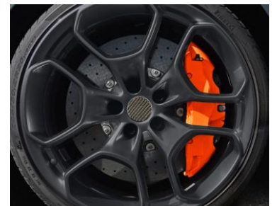
④ ホイールを組み付けた後、24時間は車を動かさないことをお勧めします。