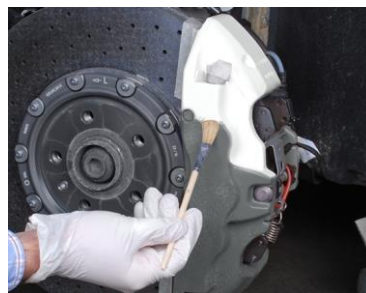
① クリーナーを使用し綺麗に洗浄した後下地用のベースコートを塗布します。