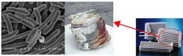
2001 Toyota without cabin air filter (123,000 miles)