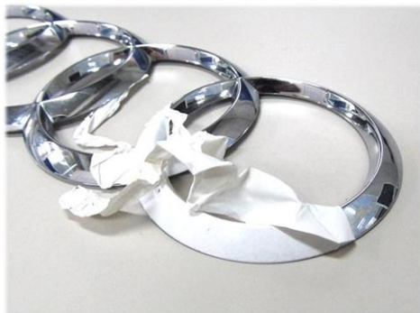
・クロムエンブレムに施工 綺麗に塗装・剥離できます。