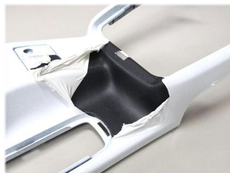
・センターコンソールに施工 綺麗に塗装・剥離できます。