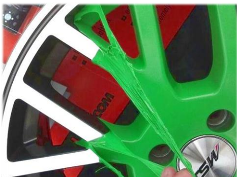
・アルミホイールに施工 綺麗に塗装・剥離できます。