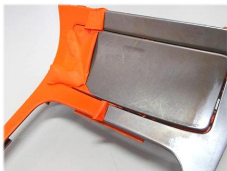
・センターコンソールに施工 パーツが変色し、ダメージが出ます