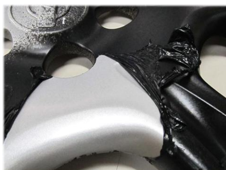
・ホイールキャップに施工 綺麗に塗装・剥離できます。