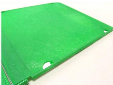
・CDケースに施工 下地まで浸透し、剥離できず。