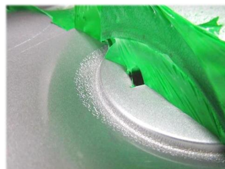
・ホイールキャップに施工 部分的に下地にダメージが出ます。