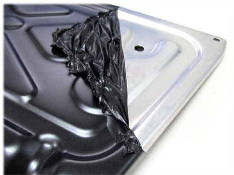
・金属パーツに施工 綺麗に塗装・剥離できます。