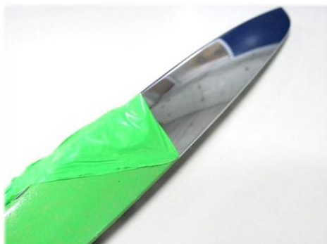
・クロムパーツに施工 綺麗に塗装・剥離できます。