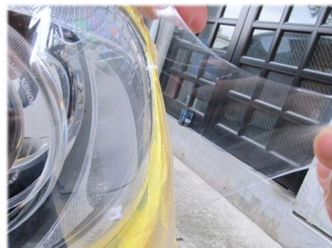
・ヘッドライトに(クリア)施工 綺麗に塗装・剥離できます。(注1)