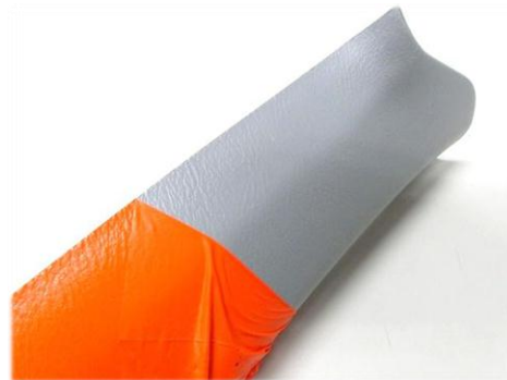
・ピラーカバー(内貼り)に施工 綺麗に塗装・剥離できます。